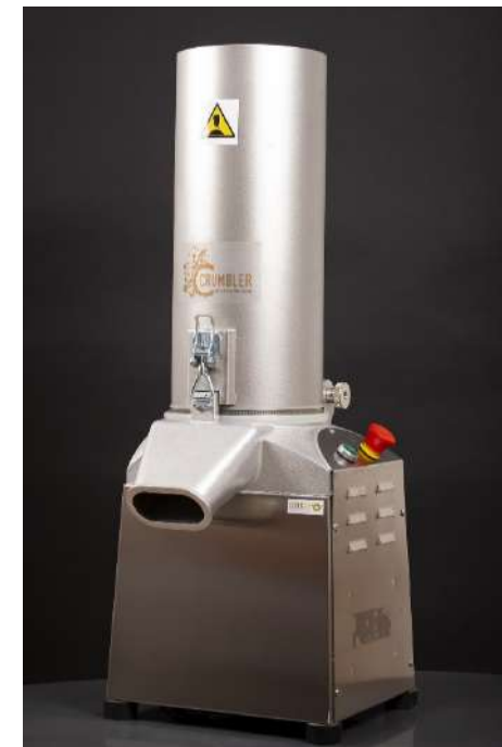
Le Crumbler 1 peut broyer jusqu'à 100kg de pain / heure