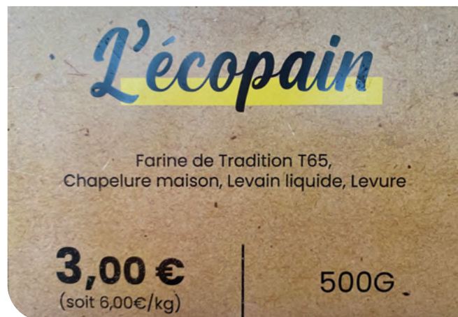
• L'Écopain de Landemaine..

On le voit, les boulangers sont très investis dans la lutte anti-gas-